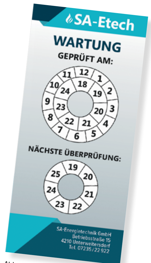
Abb. SA-Energietechnik Prüfplakette

Die Zufriedenheit unserer Kunden liegt uns am Herzen. Deshalb bieten wir Ihnen einen unkomplizierten und raschen Service. Um stets die höchsten Qualitätsansprüche zu erfüllen, bilden sich unsere Mitarbeiter laufend fort und sind mit allen Geräten, den technischen Anforderungen und Neuerungen bestens vertraut. Bei uns können Sie sich darauf verlassen, dass Reparaturen effektiv ausgeführt werden und dauerhafte Resultate erzielen. Profitieren Sie von höchster Energieeffizienz und maximaler Sicherheit.